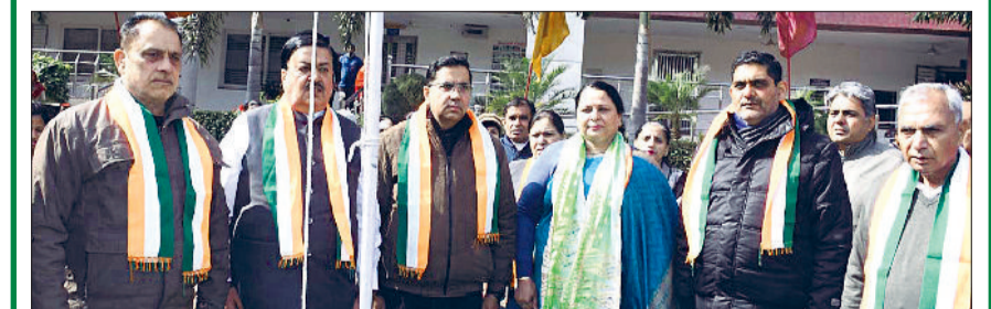
पानीपत। आईबी पीजी कॉलेज में गणतंत्र दिवस पर तिरंगा फहराते हुए अतिथि।