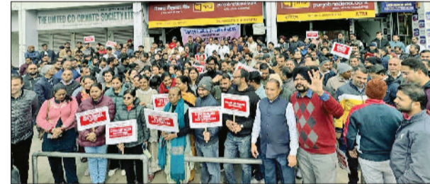
कुरुक्षेत्र। सेक्टर 13 में धरना प्रदर्शन में शामिल बैंक कर्मचारी।