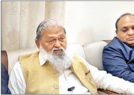
यमुनानगर। जिलास्तरीय गणतंत्र दिवस समारोह के बाद मीडिया से बातचीत करते हुए ऊर्जा मंत्री अनिल विज।

ऊर्जा मंत्री अनिल विज ने कहा कि गणतंत्र दिवस का पूरे वर्ष इंतजार किया जाता है। क्योंकि यह देश के मान.सम्मान का दिन है और इस दिन 1950 में हमें हमारा