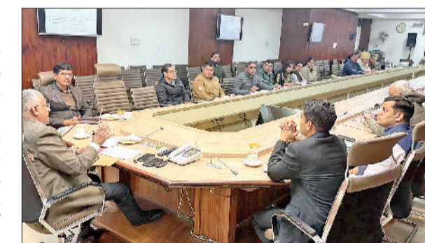
करनाल। सड़क सुरक्षा समिति की बैठक में मौजूद अधिकारी

बैठक में जानकारी दी गई कि दिसंबर 2025 के दौरान यातायात नियमों के उल्लंघन पर 34 हजार 796 चालान काटे गए, जिनके माध्यम से 80 लाख 63 हजार 900 रुपये का जुर्माना किया गया। इनमें अचर स्पीड, बिना हेलमेट, शराब