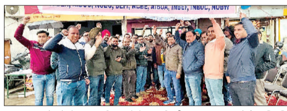
अंबाला। मांगों को लेकर प्रदर्शन करते बैंक कर्मचारी।

यूनाइटेड फोरम ऑफ बैंक यूनिंस के आह्वान पर मंगलवार को देशभर में बैंक कर्मचारियों ने अपनी मुख्य मांग 5-दिवसीय बैंकिंग सप्ताह सहित अन्य लंबित मांगों के समर्थन में एक दिवसीय हड़ताल की। इसी क्रम में अंबाला शहर स्थित मॉडल टाउन पीएनबी शाखा के सामने बैंक कर्मचारियों ने शांतिपूर्ण एवं अनुशासित प्रदर्शन किया। इस प्रदर्शन में सार्वजनिक क्षेत्र के विभिन्न बैंकों के अधिकारियों एवं कर्मचारियों ने बड़ी संख्या में भाग