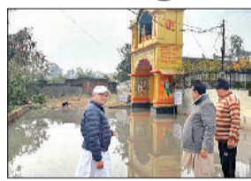
अंबाला। शमशानघाट के बाहर जमा पानी का दृश्य।