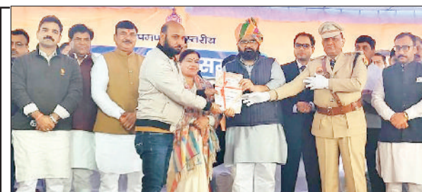
अंबाला। समारोह में उत्कृष्ट कार्य करने वाले को सम्मानित करते राज्यसभा सांसद कार्तिकेय शर्मा।

की याद में अंबाला में अंतर्राष्ट्रीय स्तर का शहीदी स्मारक बनाया जा रहा है। इसके साथ ही शिक्षा, स्वास्थ्य एवं खेलों में भी हरियाणा प्रदेश ने नई उंचाइयों को छुआ है। प्रदेश के नौजवान सेना में भर्ती होना अपनी शान समझते हैं। भारतीय सेना का हर दसवां जवान हरियाणा प्रदेश से है।